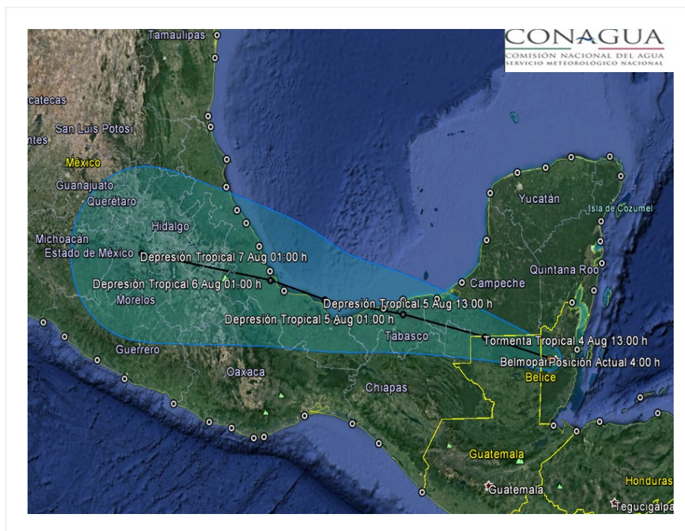
Traectoria pronóstico del huracán "Earl"